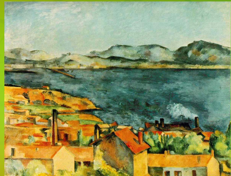
Пол Сезан, Залив Естак