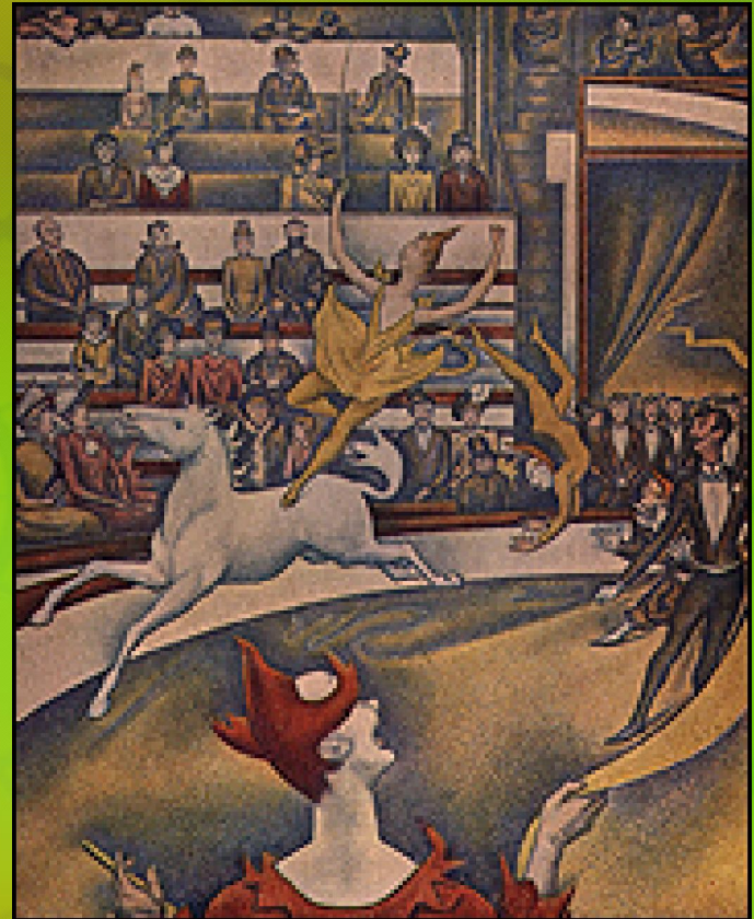
Жорж Сера, Циркус