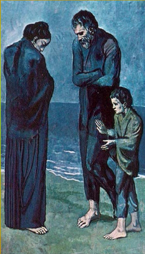
Пабло Пикасо, Трагедија