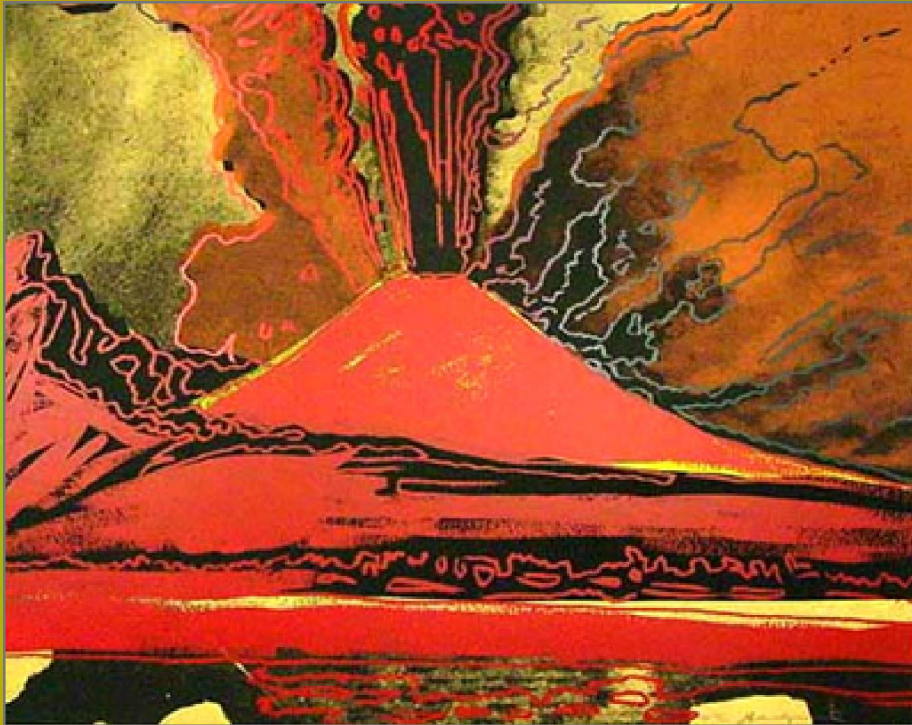
Енди Ворхол, Везув