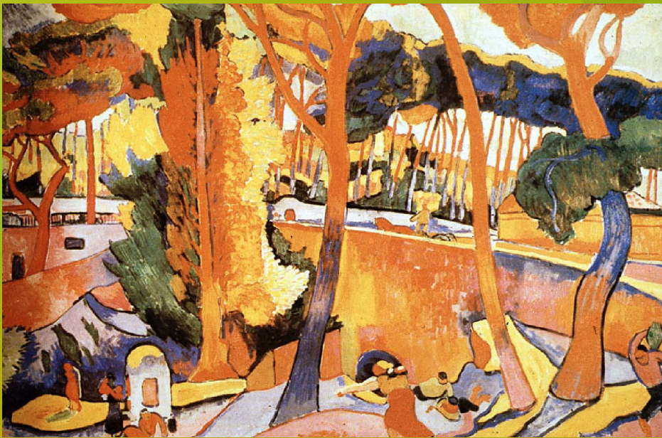
Андре Дерен, Кривина у Естаку